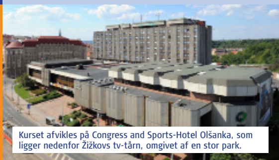
Kurset afvikles på Congress and Sports-Hotel Olšanka, som ligger nedenfor Žižkovs tv-tårn, omgivet af en stor park.

Kursusforberedelse i form af læsning og test. I alle 3 ½ kursusdage indgår oplæg, dialog og deltagerarbejde med perspektiver på institutionen.